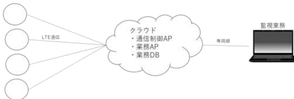
(図 社会インフラ系（電力系）のシステムサービスイメージ)

〇〇〇〇株式会社と当社で先行投資をもって新端末、新回線で利用できるアプリケーションを当社が開発作業を担当する。この準備作業の要件を以下に記述する。