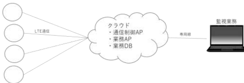
（図 社会インフラ系（電力系）のシステムサービスイメージ）

〇〇〇〇株式会社と当社で先行投資をもって新端末、新回線で利用できるアプリケーションを当社が開発作業を担当する。この準備作業の要件を以下に記述する。