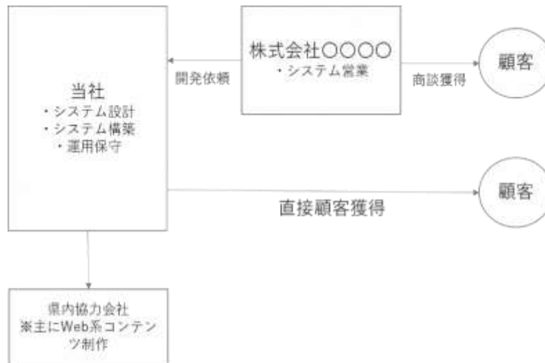
(図 システム開発の事業イメージ)