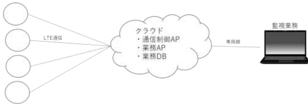
（図 社会インフラ系（電力系）のシステムサービスイメージ）

〇〇〇〇株式会社と当社で先行投資をもって新端末、新回線で利用できるアプリケーションを当社が開発作業を担当する。この準備作業の要件を以下に記述する。